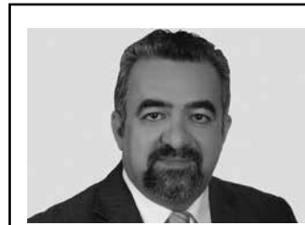
Γράφει ο: Γιάννης Πασιάς Παιδίατρος - π. Διευθυντής Παιδιατρικής Γ.Ν.Αρτας

Ο αληθινός της Καισάρειας - ο ψεύτικος της κόκα κόλα.