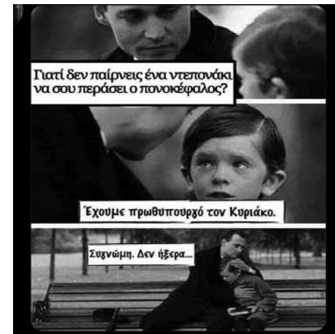
Γιατί δεν παίρνεις ένα νεπετονάκι να σου περάσει ο πονοκέφαλος?

@Τα φάρμακα σήμερα είναι σε έλλειψη επειδή είναι φτηνά, όχι όπως παλιότερα που δεν ήταν σε έλλειψη επειδή ήταν φτηνά. @Τυχαίο ότι η «έλλειψη» παρατηρείται τώρα που κάνουν πάρτι οι γρίπτες και οι ιώσεις; @Υπουργέ δεν έχουμε φάρμα-