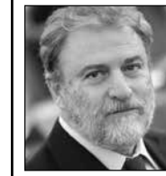
Γράφει ο: Νότης Μαρίας

Η επίσκεψη Μπάιντεν στο Κίεβο, με την σιωπηρή έγκριση της Μόσχας η οποία ειδοποιήθηκε από την αμερικανική πλευρά λίγες ώρες πριν την επιβίβαση του Αμερικανού Προέδρου στο τρένο που θα τον μετέφερε από την Πολωνία στο Κίεβο, αναμφίβολα αποτέλεσε μια σημαντική εξέλιξη στο πεδίο του πολέμου στην Ουκρανία. Και αυτό γιατί επιβεβαίωσε αυτό που ορισμένοι από εμάς είχαμε τονίσει από την πρώτη στιγμή του ξεσπάσματος του πολέμου στην Ουκρανία, ότι ο πόλεμος ήρθε για να μείνει και να διαρκέσει