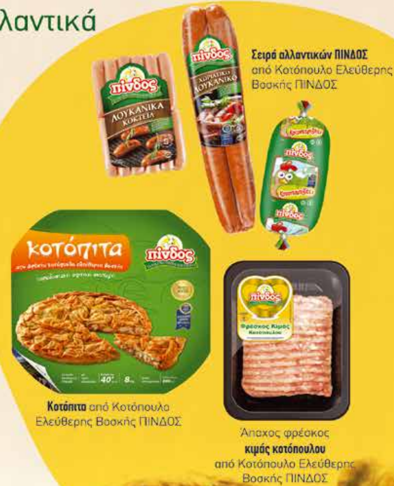
Κοτόπιτα από Κοτόπουλο Ελεύθερης Βοσκής ΠΙΝΔΟΣ