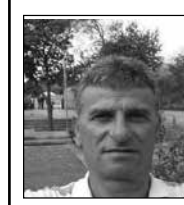
Γράφει ο: Σωτήρης Α. Δημητρίου

Ανεβαίνω νοητά, ψηλά στις άγριες και όμορφες κορυφές του Σουλίου, της Μάνης και των Σφακιών, γεμίζει καθαίο οξυγόνο κάθε μου κύτταρο και κατεβαίνει μετά ο λογισμός μου στο λεύτερο πάφλασμα του κύματος της Ύδρας, των Σπετειών και των Ψαρών και γεμίζει τα πνευμόνια λεύτερο αέρα, από εκείνον που γεμίζει τα πανιά της πατρίδας στο μεγάλο της Ελλάδα ταξίδι από την αρχαιότητα. Και ύστερα στον Μοριά, στην Τριπολιτάδα βλέπω να υαλιζέται το σπαθί του Κολοκοτρώνη προτού ο ήχος του αταλαίου βουλιάζει σε εχθρικές σάρκες και όταν ακούω την τραχιά φωνή του: